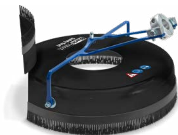
Patent: EP 2 241 173 B1